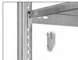
Böden liegen auf Fachbodenträgern , wenn sie nicht auf Aussteifungstraversen liegen.