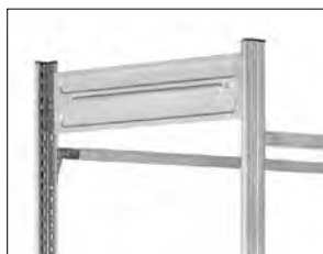
Aussteifungstraversen geben Stabilität und dienen auch zur Bodenauflage. Die Anzahl der Traversen richtet sich nach der Regalhöhe.