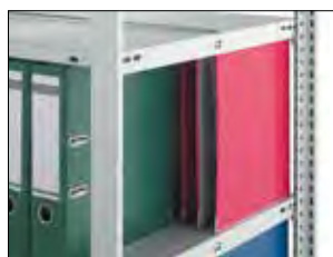
Böden mit Mittelschlagbügel